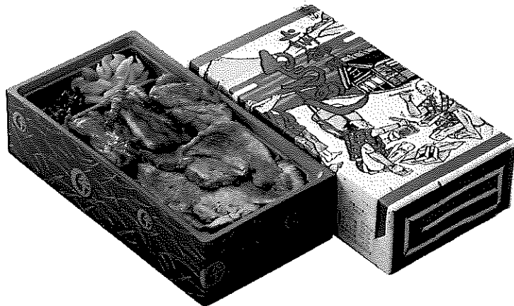
▲上州御用 鳥めし弁当(松)

人気メニュー「上州御用鳥めし」をはじめ、各種バラエティ豊かに取り揃えてあります。