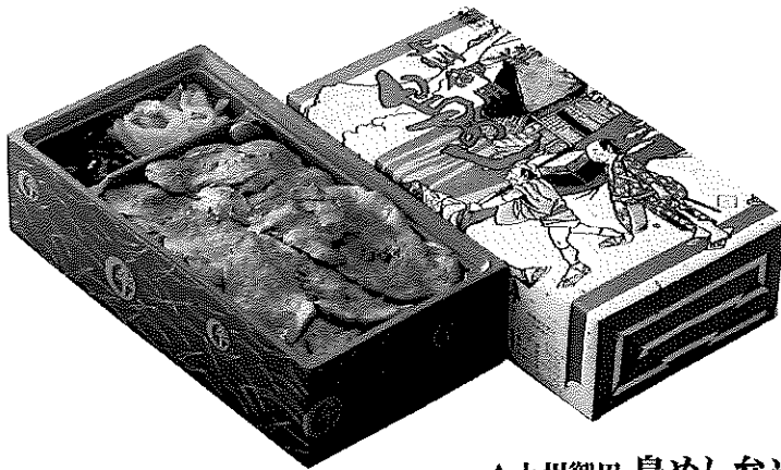
▲上州御用 鳥めし弁当(竹)

秘伝のタレと厳選された鳥肉で創業当初から人気を博している「鳥重」を気軽にテイクアウトできるようにした「上州御用鳥めし」。老舗の技と心意気が息づくその味は、県内をはじめ多くの皆様に愛される上州名物です。