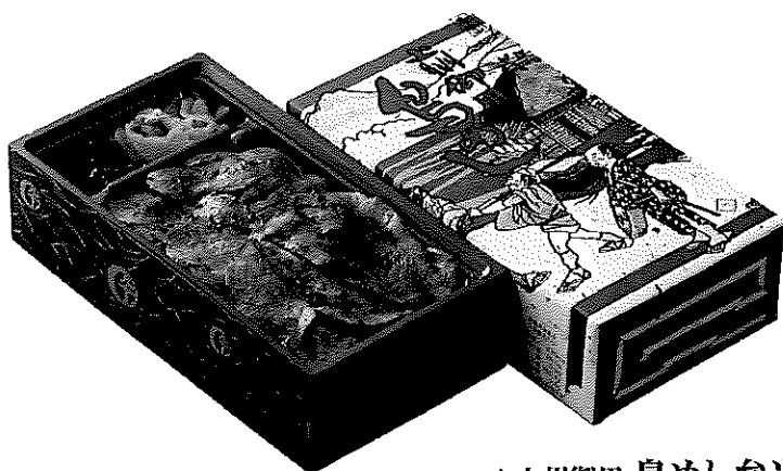
▲上州御用 鳥めし弁当(竹)

秘伝のタレと厳選された鳥肉で創業当初から人気を博している「鳥重」を気楽にテイクアウトできるようにした「上州御用鳥めし」。老舗の技と心意気が息づくその味は、県内をはじめ多くの皆様に愛される上州名物です。