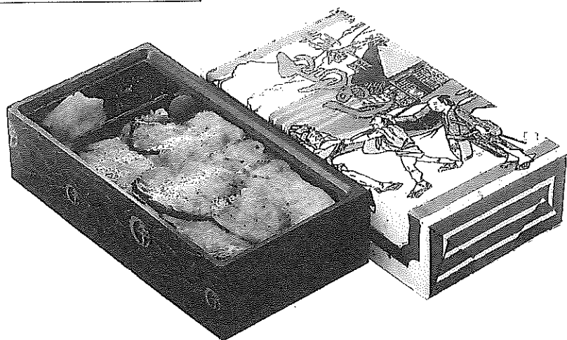
▲上州御用 鳥めし弁当(竹)